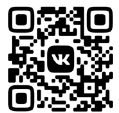
ПАБЛИК В СОЦСЕТИ «ВКОНТАКТЕ» HTTPS://VK.COM/KAFEDRA_DZOT

Созданная группа в соцсети позволит учителям физкультуры оперативно обмениваться лучшими практиками, делиться опытом регионов, конкретных образовательных учреждений.