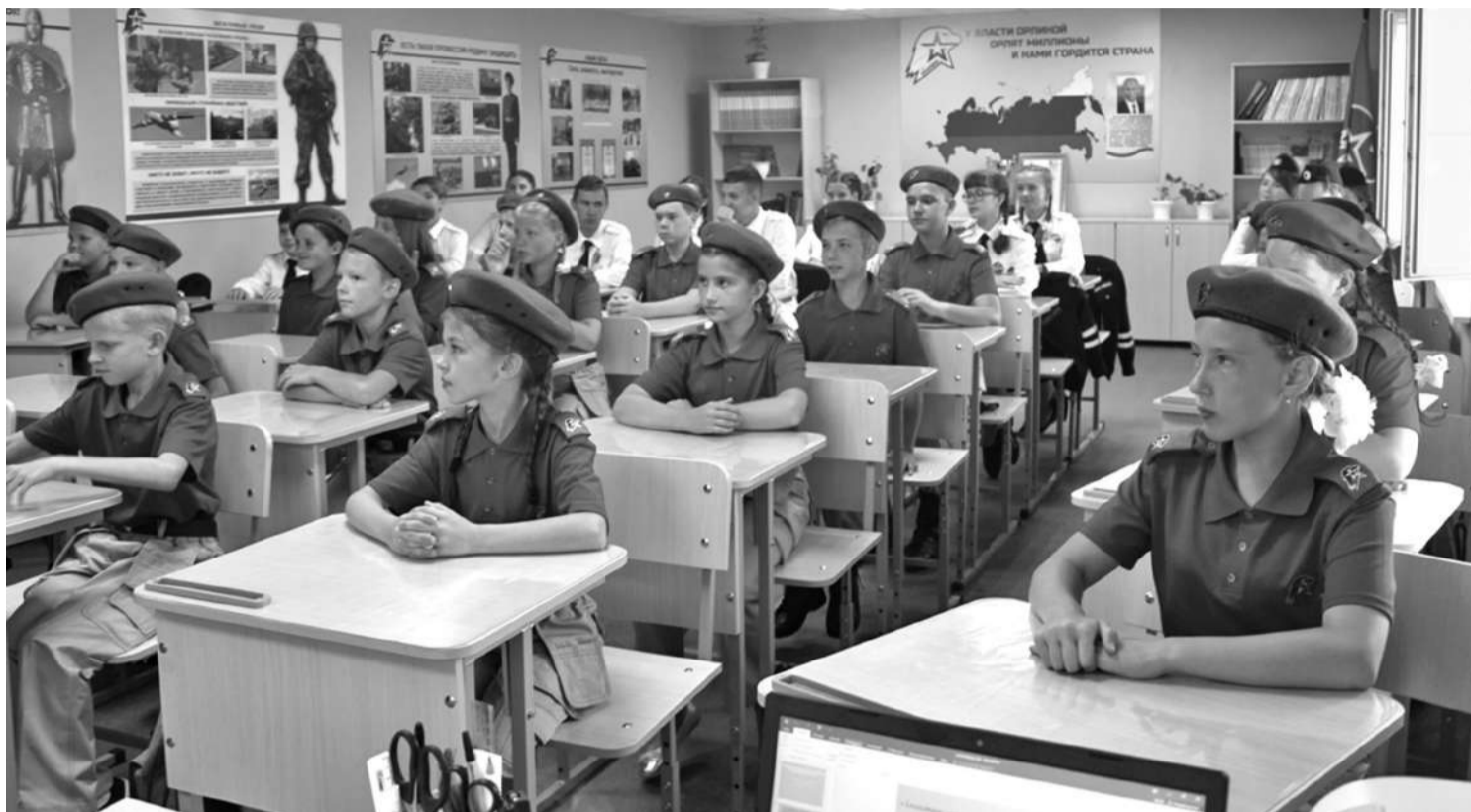
Кадетский класс школы № 1

В результате реализации проекта в школе создали лабораторию, которую можно без преувеличения назвать кузницей пытливых, талантливых юных исследователей. Ученики от четвёртого до выпускного классов занимаются наукой. В рамках постпроектной деятельности рядом с лабораторией оформлена развивающая зона «Химия занимательная и увлекательная», которая рассказывает об опытах,