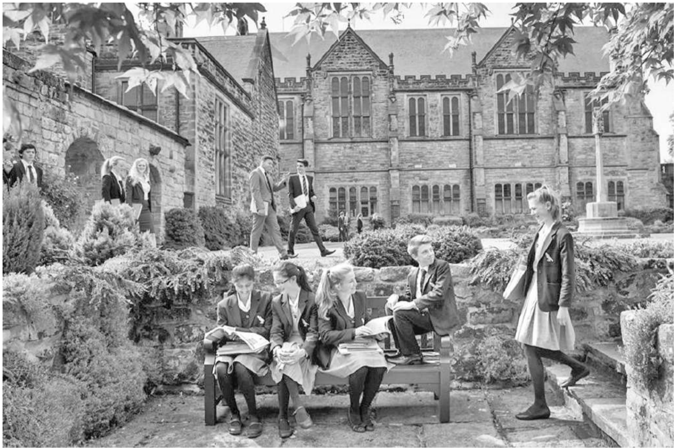
В некоторых канадских школах от формы и не думали отказываться