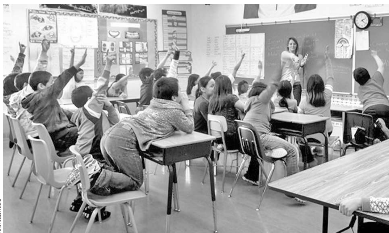
Занятия в одной из канадских школ