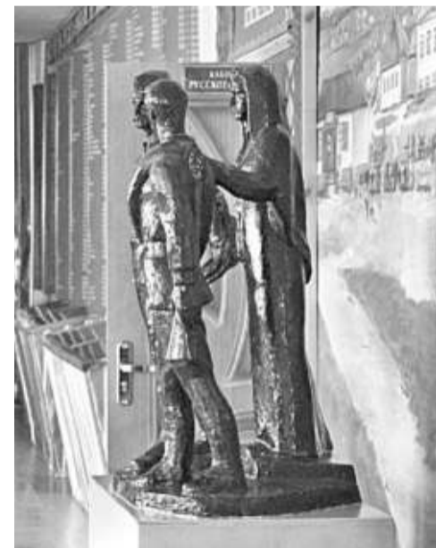
Школьный музей Великой Отечественной войны

Уверена в том, что в школе всегда ведущей и главной должна быть функция воспитания, ответственности за формирование человеческой личности. В детях необходимо формировать нравственные принципы, делая это незаметно и каждодневно. В нашей школе детей и педагогов связывают