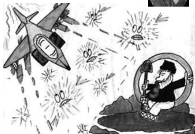
А вот таким детским «видением» браздов, ямщика и кибитки делятся друг с другом пользователи Интернета