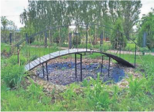
Уразовская школа № 2 Валуйского городского округа