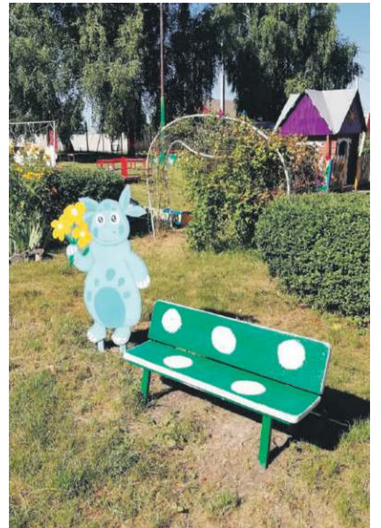
Детсад № 4 с. Алексеевка Корочанского района