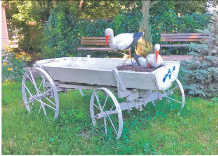
Центр образования № 1 г. Белгорода