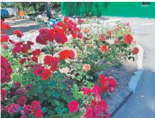
Детсад № 48 «Вишенка» г. Белгорода