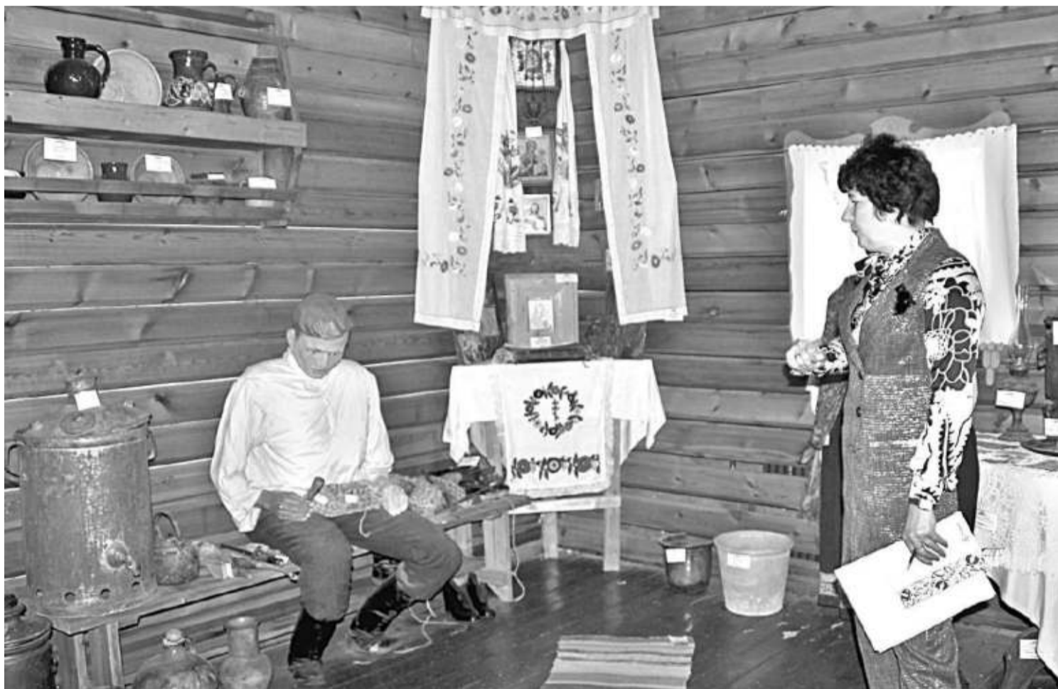
В школьном музее этнографии

НО ДАЖЕ САМОЕ КРАСИВОЕ, ПУСТЬ И ДОБРОЖЕЛАТЕЛЬНОЕ ОФОРМЛЕНИЕ МОЖЕТ СТАТЬ БЕСПОЛЕЗНЫМ, БЕЗДЕЙСТВЕННЫМ,