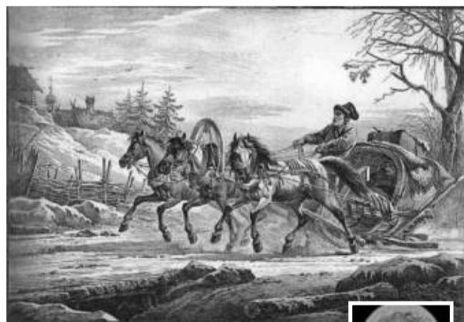
Настоящая кибитка — это крытая повозка, как на этой литографии Александра Орловского «Путешественник в кибитке, или Сани, запряжённые тройкой» (1819, Киевская картинная галерея)

Другие ученики назвали кибитку «птичкой», летящей с Кубы и крыльями поднимающей снег»; «поездом, который очень быстро едет, и поэтому снег летит вверх и вниз» и даже «кибернетической, шустрой тёткой». Ямщик, по их мнению, оказался «дядей, профессия которого — таскать ящики»; человеком, роющим ямы, вероятно, карликом, «потому что сидит на чём-то маленьком и прячется в ямку».