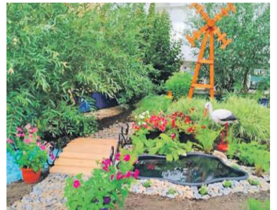
Рождественская школа Валуйского городского округа