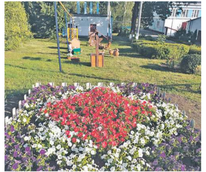
Старобезгинская школа Новооскольского городского округа