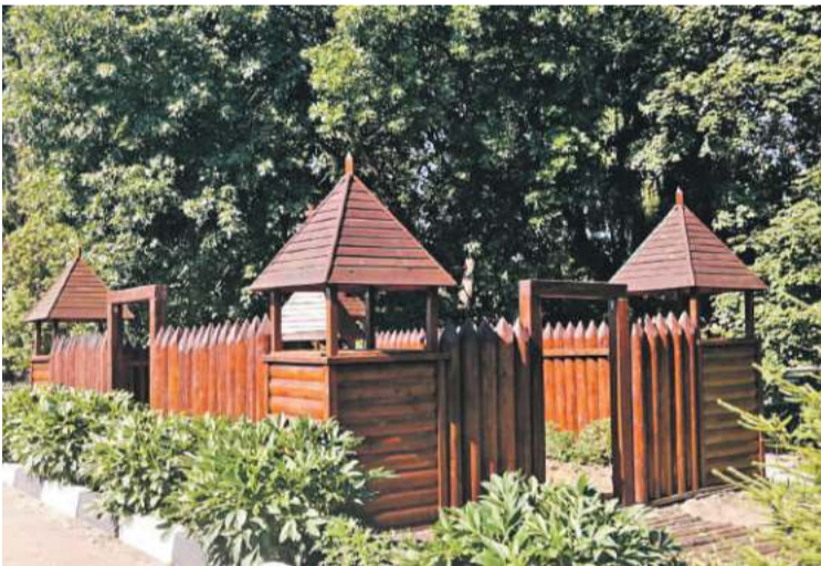
Школа № 4 г. Валуйки

Школа начинается со школьного двора. От того, как он обустроен, зависит многое. Настроение ребят и учителей. Их желание идти в школу. Адаптация первоклассников к учебной жизни. Недаром на Белгородчине уже много лет проводят конкурсы на лучшее обустройство школьных территорий. Если к делу подойти с душой, то школьный двор можно превратить и в ботанический, и в сказочный сад, и в обучающее пространство. В группе «Доброжелательная школа Белогорья» в соцсети «ВКонтакте» мы попросили учителей и учеников поделиться с редакцией фотографиями дворов их школ. И детских садов. Давайте вместе полюбуемся на нашу школьную красоту! Ну и в нашем редакционном портфеле кое-что нашлось.