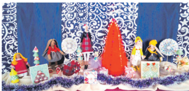
Подделки ребят из объединения «Умелые ручки»