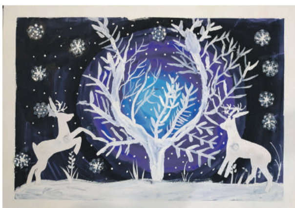
«Зимняя сказка». Рисунок Алексея Чудных (руководитель Дина Кислиця)