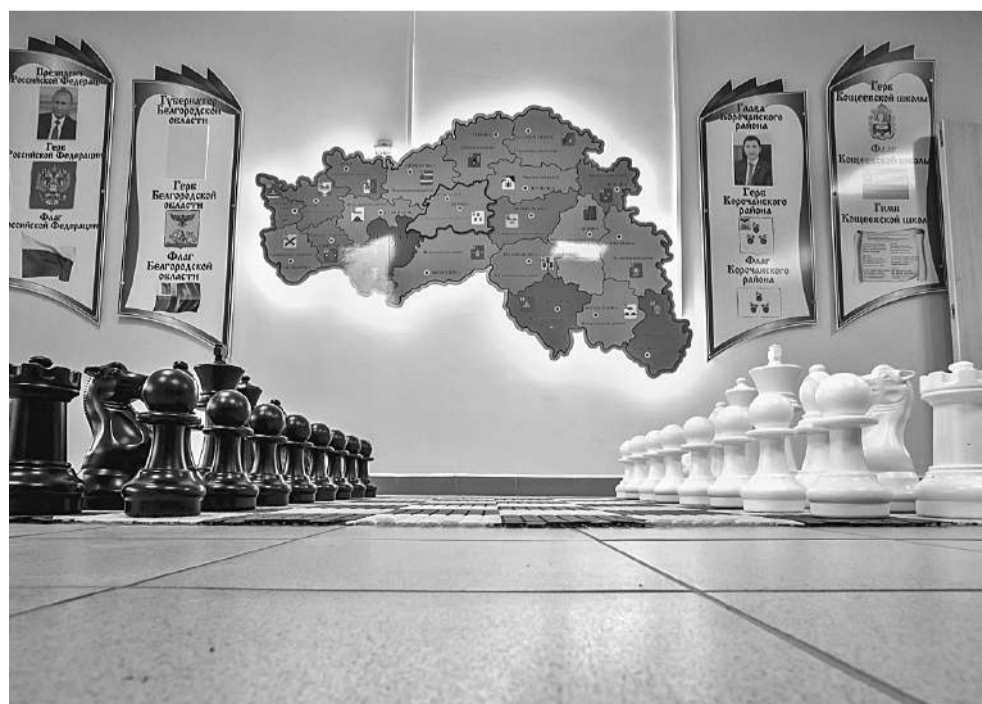
Оформление стен в Кожевской школе Корочанского района