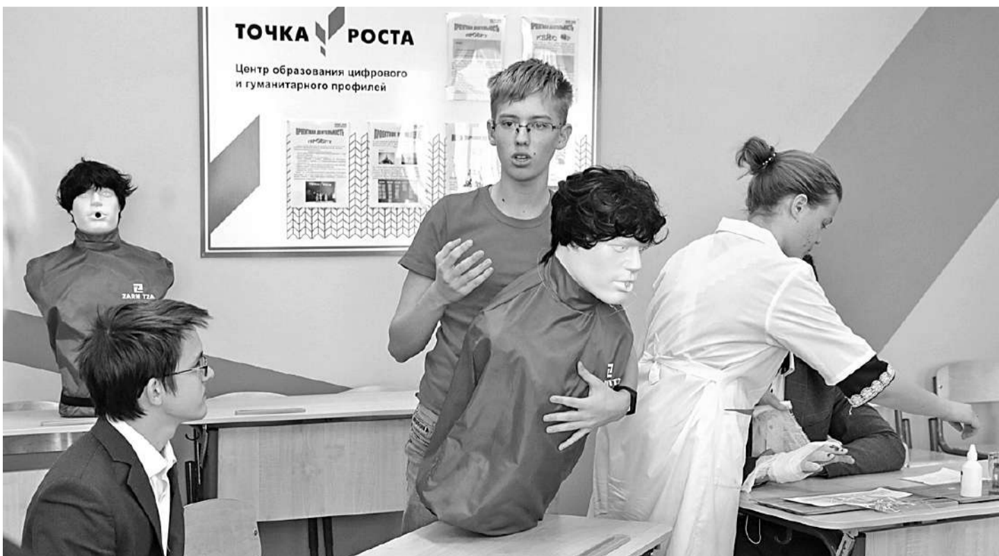
Оказывать первую помощь пострадавшим школьники учатся на манекенах-тренажёрах