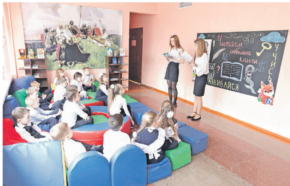
В рамках проекта «Дети — детям» старшеклассники читают книги ученикам начальной школы (Ровеньская школа с углублённым изучением отдельных предметов)